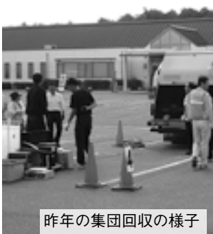
昨年の集団回収の様子

※開庁時間内、開館時間内に利用できます。 ※環境センターは、月・火・金曜日の13時〜16時30分に限り(祝祭日・年末年始除く)。