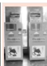
市役所玄関の回収ボックス

スを市内10か所に設置しています。手のひらサイズの小型家電はこちらもご利用ください。