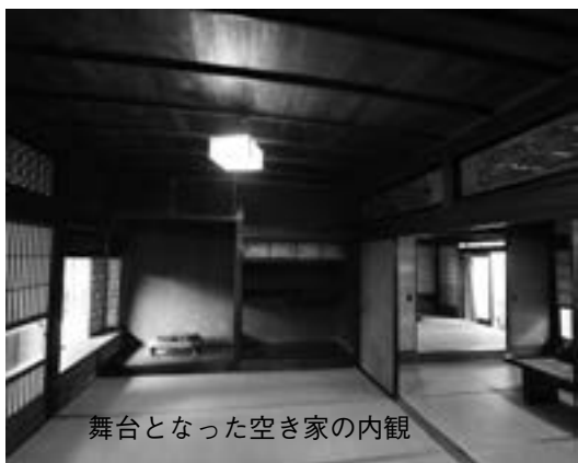
舞台となった空き家の内観

来年度以降、改修工事を進めていきます。空き家リノベーションが竣工し、どのようなリノベーションが施されたのか、改めてお知らせしますので、オープンを楽しみにお待ちください。