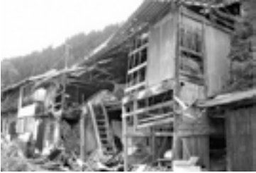
特定空家等の例（国交省HPより）

特定空家等について、必要な措 置を取るよう勧告された場合に は、住宅用地 特例の対象か ら外れ、法律 に基づき固定 資産税が高額 となるなど、 所有者・管理 者の負担も増 大します。