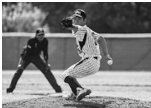
8月にローマで開催された「第38回世界少年野球大会」では投手として活躍

これからも地道な努力を続け、物怖じすることなく、思い切りの良さを武器に、将来、プロ野球選手を目指して頑張ります。