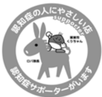
認知症の人にやさしい店ステッカー

「認知症にやさしい店」ステッカーをお渡しします。また市のホームページにも認知症の人にやさしいお店・事業所として掲載します。