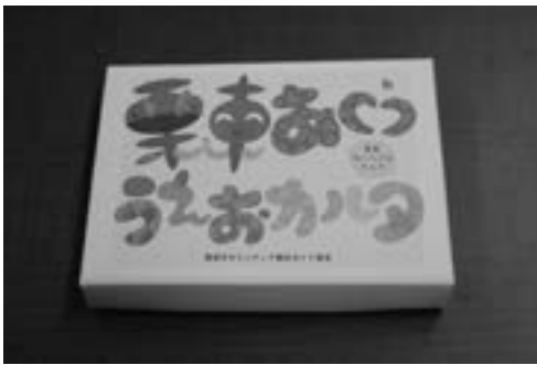
寄贈された「栗東あいうえおカルタ」

栗東市ボランティア観光ガイド協会は「温故知新」「不易流行」をモットーに、いにしえを今に繋ぐ「郷土栗東の語り部ガイド活動」を行う団体です。