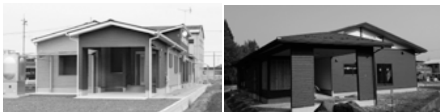
小規模多機能型居宅介護事業所 心のさと 小規模多機能ホーム 志