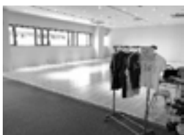
500のダンス& カルチャースタジオ 栗東市穂2-4-5 ウイングプラザ2階

※「現在開業している」、「賃貸借契約を締結済み」、「店舗の改装工事を発注済」など市が補助金の交付決定を行う前に事業に着手しているケースは補助対象外となりますのでご注意ください。