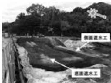
撮影日 2019年11月22日 〈滋賀県最終処分場特別対策室資料引用〉

※地下水などの利用にあたっては引き続き十分に留意ください。 ■底面遮水工、側面遮水工の施工完了状況