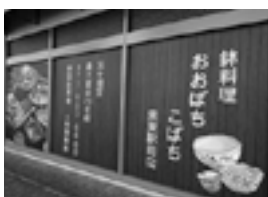
おおぼち こぼち 栗東市穂2-4-15 ウイングプラザ1階