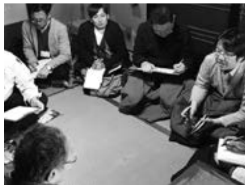
「住まいの記憶史」調査の様子

昨年9月ごろより、同事業の取り組みの一つである「住まいの記憶史」作成に向けた聞き取り調査を実施しました。美しく歴史ある家屋を後世へ受け継ぐことで、地域のまちづくりにつなげようとう始めた取り組みであり、調査対象は、歴史街道沿道の空き家所有者など、3物件の人に語り手としてご協力いただきました。