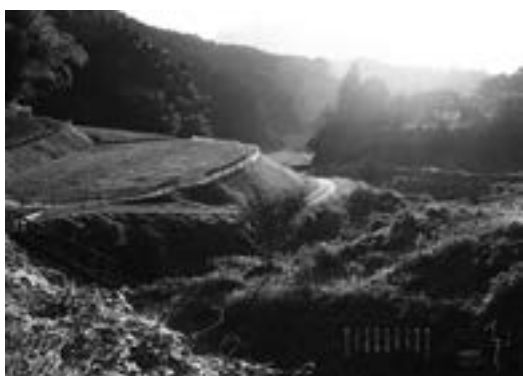
「住まいの記憶史」リーフレット

「家財の見直しや処分・活用を検討するきっかけとなった」「地域への思い入れを見つめ直すいい機会だった」など、語り手の皆さんが同調査をこのように振り返ります。調査を通じて、家屋に向けた愛着や、地域づくりにおける大切な思いなどの掘り起こしにつながったのではないのでしょうか。