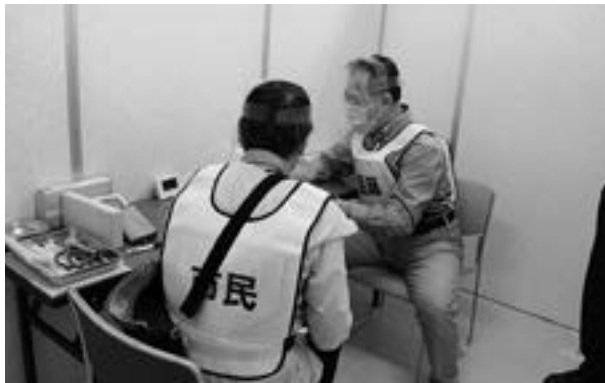
②予診票確認後、医師が予診