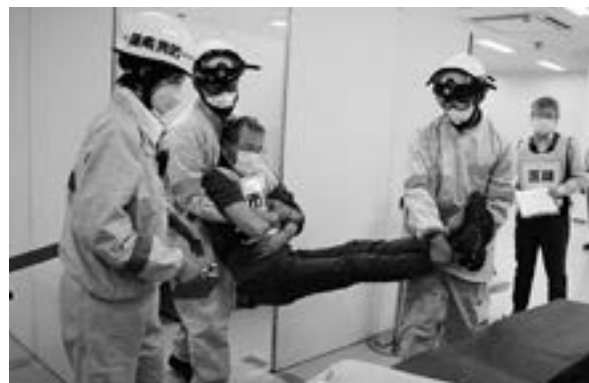
▲副反応による患者を救急隊が搬送