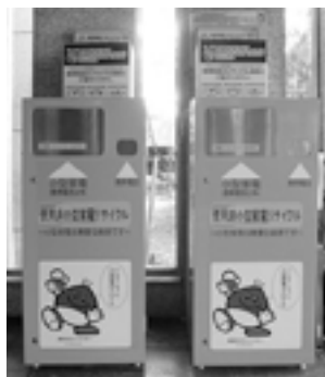
▲市役所玄関の回収ボックス

使用済み小型家電の回収ボックスを市内10か所に設置しています。投入口に入る使用済み小型家電についてはこちらでもご利用ください。