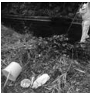
▲水路からあげられたゴミや刈草

水が多く流れる時期の、水路付近は大変危険です。特に台風時や急な大雨が降った時には増水の危険もありますので、大きな水路や水量の多い水路には近づかない、近づかせないようにお願いします。