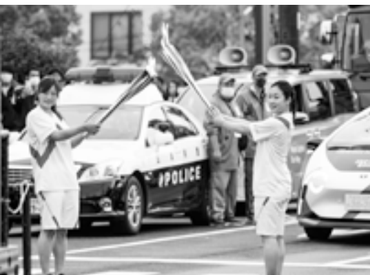
▲東京2020オリンピック聖火リレー