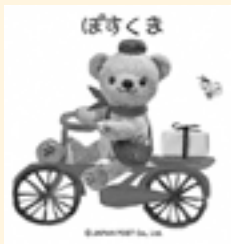
ぼすくまは日本郵便のキャラクターです