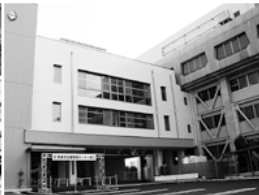
▲危機管理センター