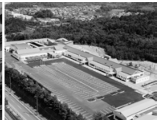
▲総合福祉保健センター(なごやかセンター)