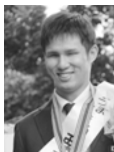
木村 敬一 さん (競泳選手)

現在私はフランスでプレーしています。毎日学ぶことばかりですが、感謝を忘れずもっと成長できるように一日一日を大切に頑張りたいと思います。2022年、皆さまに沢山の幸せが訪れますようお祈り申し上げます。