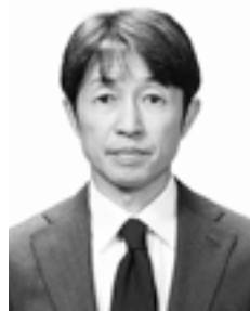
日本騎手クラブ 関西支部 武豊さん (日本騎手クラブ会長)

うますぎる栗東大使の皆さんより、新年メッセージをいただきました。2022年も大使のさらなる活躍に注目です。