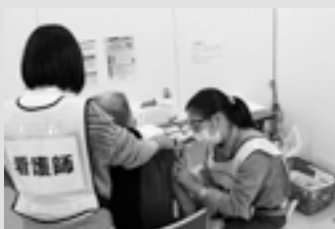
ワクチン接種(3回目)の実施風景