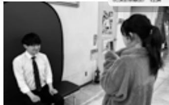
申請に必要な写真は市役所で撮影できます