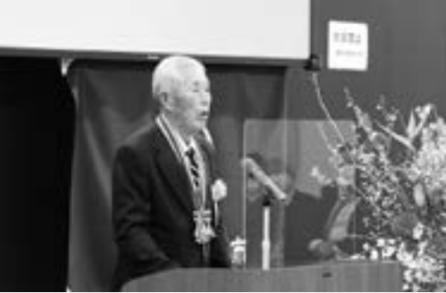
▲被表彰者代表謝辞