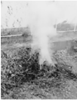
図 環境政策課 環境政策係

刈り取った草や剪定した枝を含め、家庭から出るごみは正しく分別し、適正に処分してください。