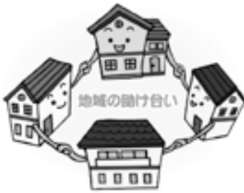
図 上下水道課 浄水係