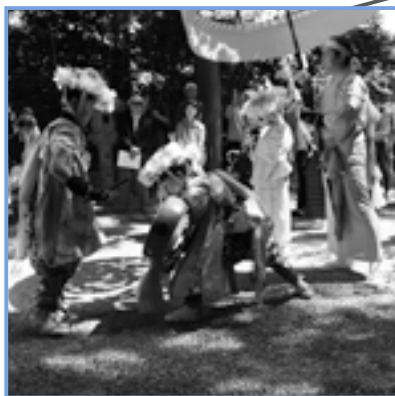
境内の龍王社前で一踊り