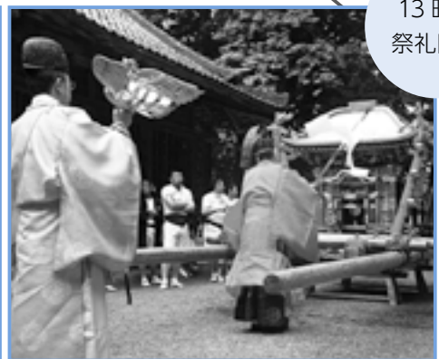
神輿に鳳凰がとりつけられ、渡御の準備が整います。