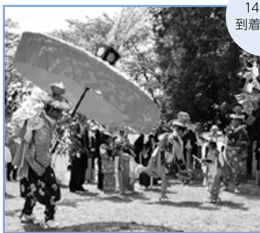
御旅所 (岡地先) での奉納の踊り