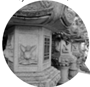
「真向きのうさぎ」は神社の随所でみられます