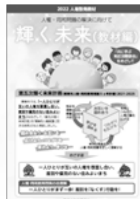
▲今年度の「輝く未来（教材編）」の電子データはこちら