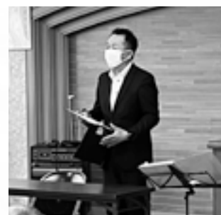
地区別懇談会の様子

今後も、人権の学びを深め、お互いを認め合い、つながりを広げて、人権が尊重された地域づくりのために、市民の皆さんの積極的な参加をお願いします。