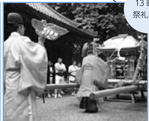
神輿に鳳凰がとりつけられ、渡御の準備が整います。

で大変貴重な歴史文化資産です。今年には川辺が祭りの当番です。新型コロナウイルスの感染状況をしながら、工夫して祭礼の準備をし、みんなで伝統をつないでいきたいと思っています。