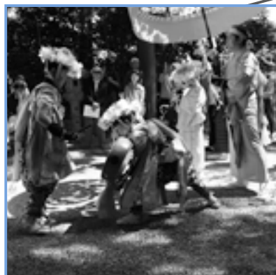
境内の龍王社前で一踊り