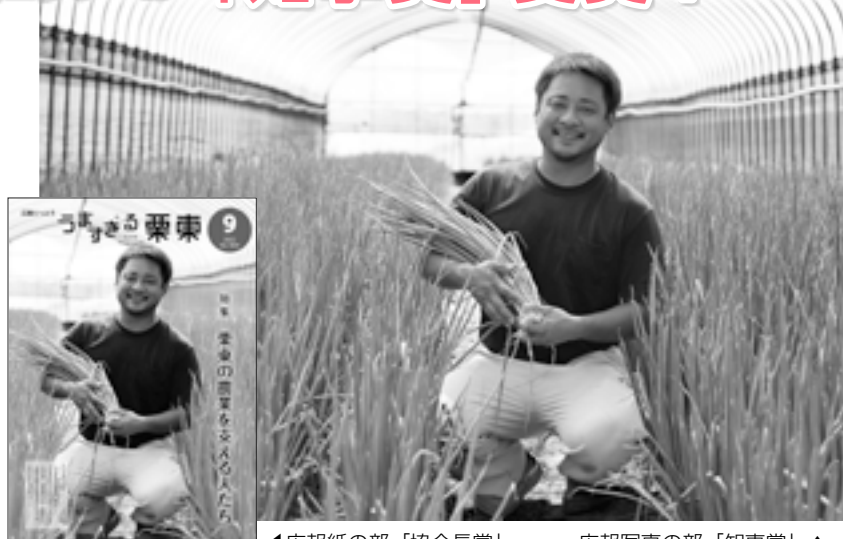
◀ 広報紙の部「協会賞」

令和4年滋賀県広報コンクールで、広報りっとう9月号が「広報紙の部」「広報写真の部」の2部門で、受賞しました。「広報写真の部」では2年連続受賞し、今年最高賞である「知事賞」を受賞しました。 受賞できたのは、取材に協力いただいた皆さんや関係者の皆さんのおかげです。今後も栗東の魅力を発信し、親しみやすく、読みやすい「伝わる」広報紙を目指していきます。