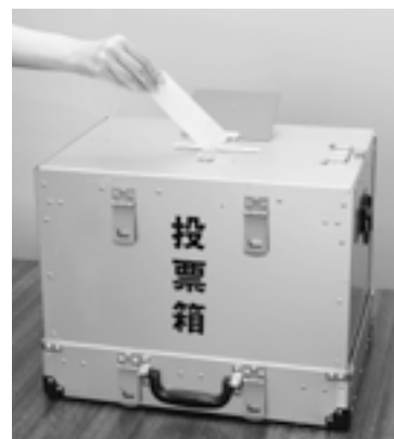
選挙管理委員会 ☎ 553-1234 (代) FAX 554-1123

対象となるのは、投票当日、仕事や用務、旅行などの予定のある人、病気や負傷、身体の障がいなどのため歩行が困難な人などです。