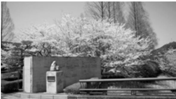
正面玄関から望む桜とメタセコイア