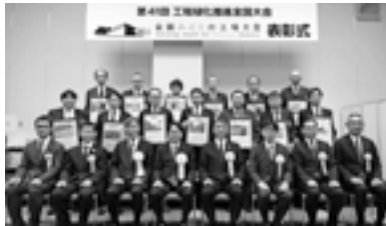
全国みどりの工場大賞 表彰式