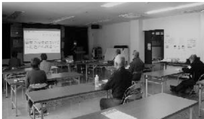
栗東市の歴史を学ぶ