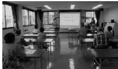
災害への対応を学ぶ