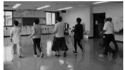
ノルディックウォーキングの体験