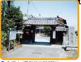
⑧ 永正寺 (足利義尚陣所跡)