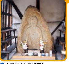
⑪ 大日堂 (大日如来)