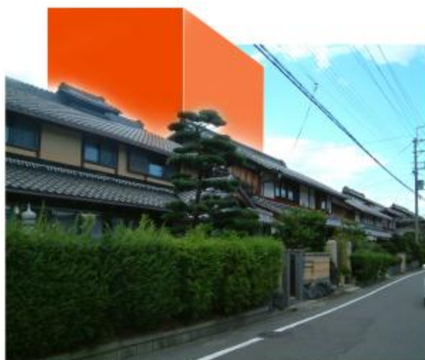
4階建の建物が建った場合