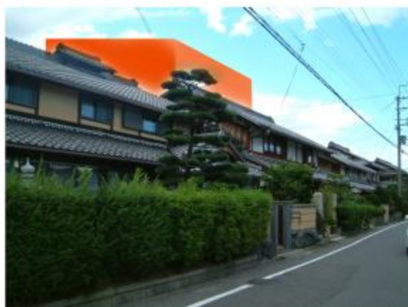
3階建の建物が建った場合