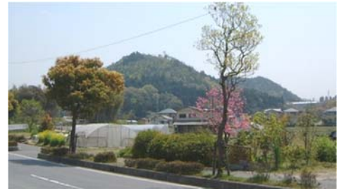
日向山風致地区を眺む