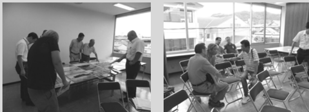
委員会終了後も、熱心な意見交換が見られました！