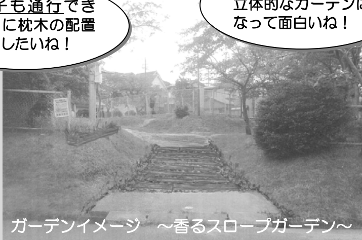
ガーデンイメージ ～香るスロープガーデン～