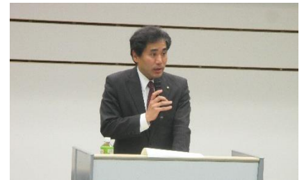
宮本 守山市長挨拶(総会時)