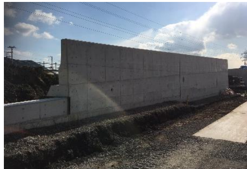
盛土工及び擁壁工