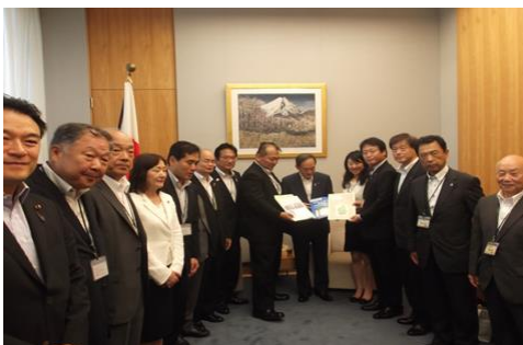
菅 官房長官へ要望活動（首相官邸内）

H29.8.4 菅 内閣府官房長官、三木 財務政務官、海堀 内閣府政策統括官（防災担当）、和田 国土交通省道路局次長他