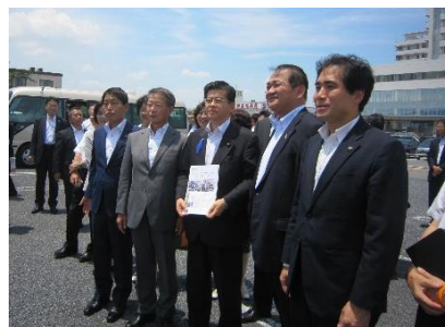
石井 国土交通大臣へ要望活動

H29.7.15 石井大臣が滋賀県（国道 8 号野洲栗東バイパス他）を視察されるにあたり、国道 8 号の現状や事業の概要、バイパス整備による事業効果等を説明し、早期完成に向け、継続的な予算措置・道路財特法の延長等の要望活動を行いました。