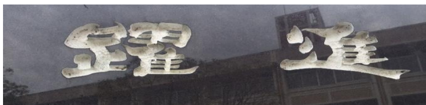
時を守り、場を清め、礼を正す

令和6年度がはじまりました。葉山中学校は創立40周年となります。本校が創立されてから様々な取り組みがなされてきました。体育館に掲げられている「生徒憲章」は、定めた当時の生徒の主体的な取り組みによって定着し、伝統となっているものです。近年では「ノーメディアデー」の取り組みで、現在の課題である情報端末の利用の仕方を各個人が考え、行動するものとして実施しています。また、本年度入学生から制服が改定され、この節目の年に新たな時代に向かうにふさわしい変化だと考えています。また、社会や中学校を取り巻く状況が大きく変わってきています。部活動では、地域スポーツ団体からの参加や各競技の状況によって独自性が認められるようになってきました。さらに、本校が大切にしている「生命の尊重」や「人権」についても社会情勢の変化や情報技術の進歩によって課題が変化しています。さまざまな変化から学ぶことも、これからの時代に対応できる資質・能力を高めることにつながります。人生の基盤として、葉山中学校で一緒に学びましょう。