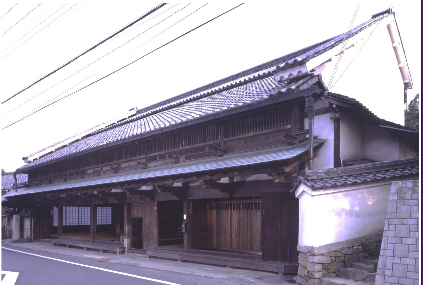
重要文化財 大角家住宅