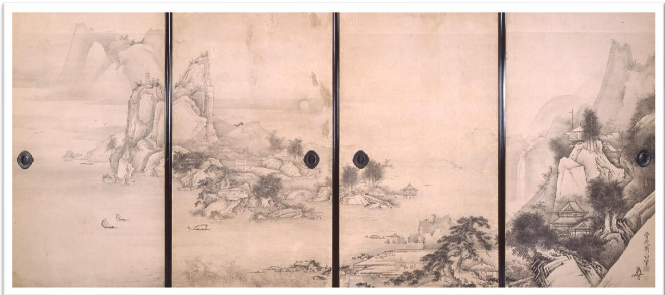
曾我蕭白画「楼閣山水図」(18世紀)