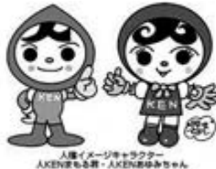
人権イメージキャラクター 人権広場もも君・人権広場あひちゃん