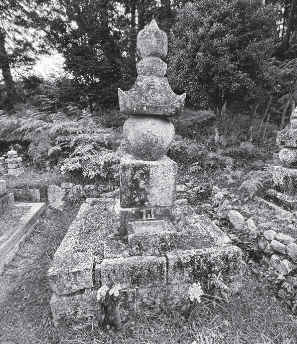
▲宮城豊盛墓(栗東市東坂 阿弥陀寺宮城家墓所)