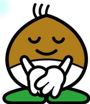
栗東市マスコットキャラクターくりちゃん

経済的な理由等により、 生理用品の購入に困っていませんか？ また、ひとりで悩んでいませんか？