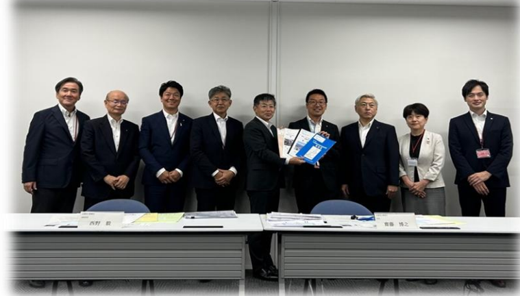
国土交通省近畿地方整備局へ要望活動