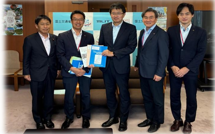
国土交通省へ要望活動

さらに、沿線企業から寄せられた「早く使いたい！」という期待の声も届け、令和8年度の部分開通と早期の全線開通に向けた機運がますます高まっています。