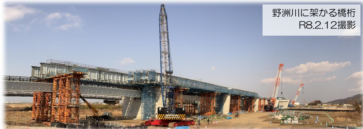
野洲川に架かる橋桁 R8.2.12撮影