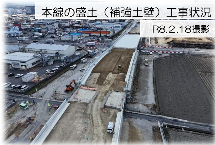
本線の盛土（補強土壁）工事状況