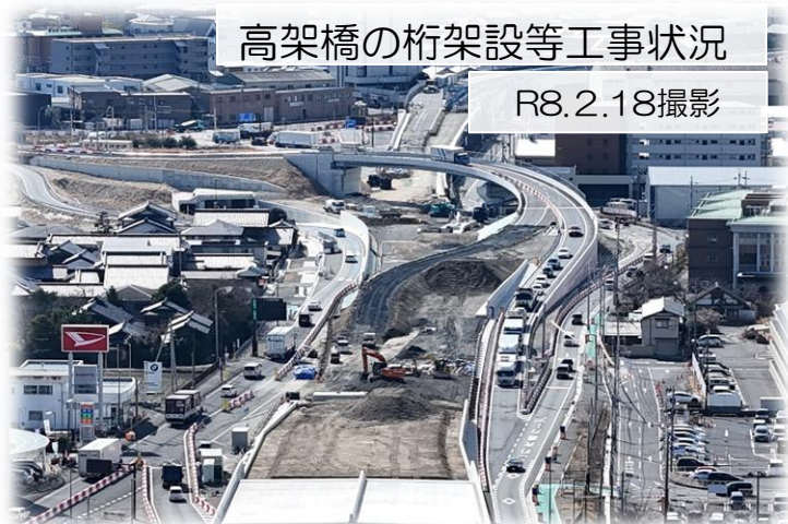
高架橋の桁架設等工事状況