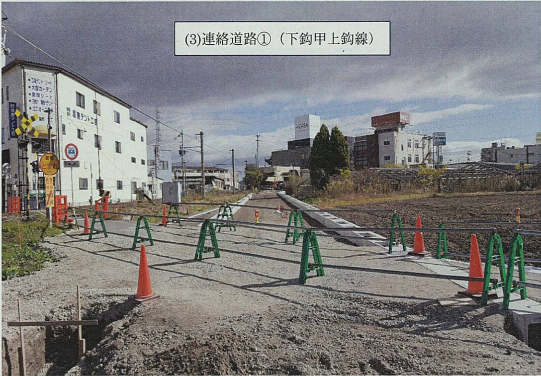
(3)連絡道路① (下鈎甲上鈎線)