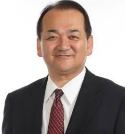
草津栗東防犯自治会会長 (栗東市長) 野村 昌弘

草津栗東防犯自治会 Tel.077-551-0109 ● 草津警察署 Tel.077-563-0110