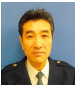
草津栗東防犯自治会顧問 (草津警察署長) 清水 俊昭