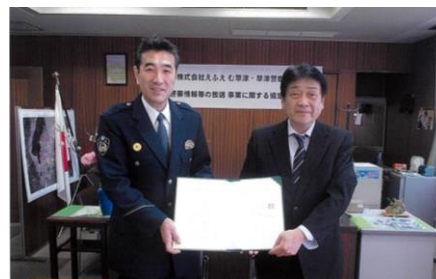
▲えふえむ草津と締結式を行いました

3月3日草津警察署にて、えふえむ草津と草津警察署が協定書を締結しました。今後月2回、番組内で草津警察署から住民へ、犯罪や事故から守る防犯情報等が放送される予定です。