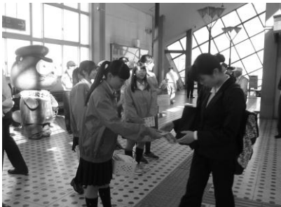
▲栗東中学校 ヤングボランティアの会「栗東中」