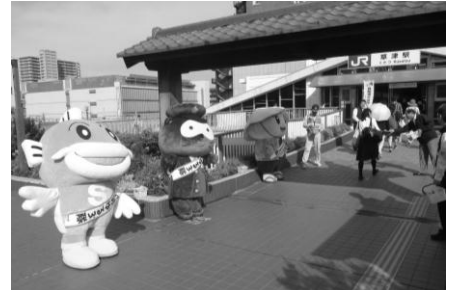
▲セレモニーの後、草津駅前啓発

5月16日、JR草津駅で自転車盗難防止の啓発を実施しました。犯罪ゆる3隊の「キャプティ」「けいたくん」とともに、地元草津市のゆる3隊の「たび丸」が、滋賀県自転車商業協同組合草津栗東支部、滋賀県、草津署、草津市の関係機関が協働で駅利用客に啓発品を配布し、自転車のカギかけを呼びかけました。