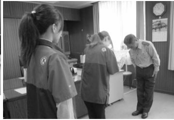
▲サークルK草津団地前店

5月19日、セブンイレブン草津青地町店のマネージャーと店員に対して、6月8日、サークルK草津団地前店と同店副店長と店員に対して、それぞれ署長感謝状が贈られました。受賞者は、来店客が高額のギフトカードを購入しようとした際、電子マネー使用の架空請求詐欺ではないかと不審に思い、積極的に声をかけました。同時に草津署から配布された水際防止用の「けいたくん重要なお知らせカード」を手渡し、購入理由について確認したところ、そのカードを見た来店客はその場で詐欺だと気づき、未然に詐欺被害を防止しました。