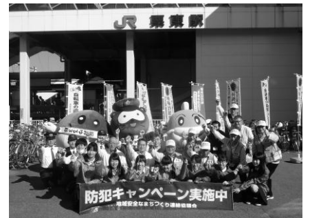
▲全員で声を揃えて「犯罪はゆるさん!」

5月19日、JR栗東駅では、地元の栗東中学校ヤングボランティアの会「栗東中」と、栗東西中学校ヤングボランティアの会「RW見守り隊」、総防犯ボランティアの方々が、啓発を盛り上げてくれました。上記犯罪ゆる3隊と地元栗東市のゆる3隊の「くりちゃん」が、栗東市ほか関係機関が協働で、自転車のカギかけと多発している特殊詐欺について注意を呼びかけました。