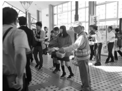
▲栗東西中学校 ヤングボランティアの会「RW見守り隊」