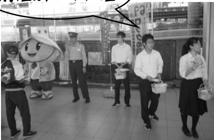
▲光泉高校ヤングボランティアSP