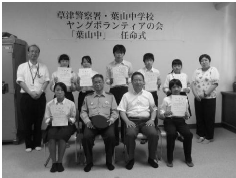
▲ 葉山中学校 ヤングボランティアの会「葉山中」の皆さん