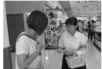
▲ 生徒の呼びかけに、買い物客らは足を止め 「気を付けるね」と言葉を返していました