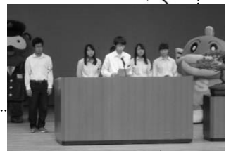
▲ 大会宣言を読み上げる 光泉高校ヤングボランティアの会「SP」

〈大会宣言〉滋賀県では、昨年の犯罪件数が過去50年で、最も少なくなりました。今年も「さらなる減少」を目標に「県民一丸」となって防犯活動に取り組み、減少を続けています。(中略)