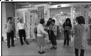
▲ アル・プラザ栗東での啓発