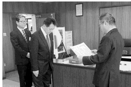
▲被害を未然に防止した功勞に対して

草津警察署長から、2月22日、京都信用金庫栗東支店と行員に対して感謝状が贈られました。同月2日、高齢夫婦が来店し、高額出金を申し出たため、行員が出金理由を確認したところ、「息子に渡す。息子は風邪をひいているようで声がおかしかった。ビットコインで失敗したらしい。」等と答えたため詐欺被害を疑い、粘り強く説得をすると共に息子本人に連絡させるなどして、被害を未然に防止しました。