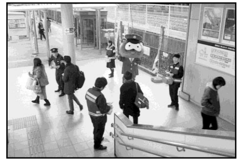
▲ 自転車のカギかけを呼びかけ