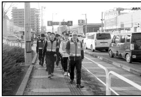
▲ 全員で、防犯パトロール