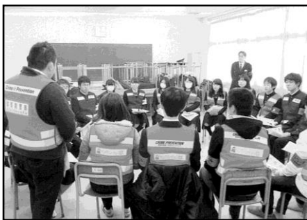
▲ 意見交換会の様子

2 月 23 日、光泉高等学校で、県警本部と草津警察署が「～若者の力で、自転車盗難被害防止～」をテーマに、ヤングリレーション滋賀と光泉高等学校ヤングボランティアの会「SP」のメンバーらとの意見交換会を開きました。会では啓発グッズ選びの他、効率良く活動をするポイントや質問など活発な意見が飛び交いました。その後、JR 南草津駅まで徒歩で防犯パトロールを行った後、同駅前で駅利用客に対して啓発品を配布するなど、自転車盗難被害防止を目的とした啓発活動を実施しました。