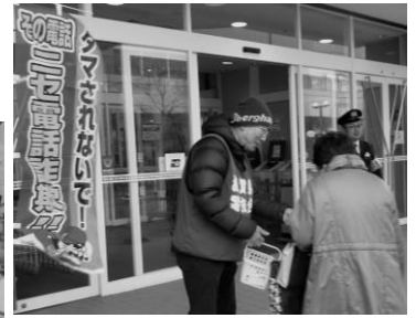
▲ アル・プラザ栗東