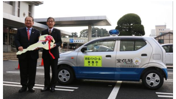
▲ 防犯協会専務理事から栗東市長へ 記念の鍵が手渡されました