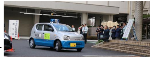
▶ 拍手で見送られる中、パトロールに出動しました