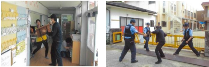
左/金勝学童保育所、右/玉川幼稚園

また、7月12日にも、草津市の玉川幼稚園で同様の訓練を実施しました。訓練終了後、おまわりさんから園児たちに、「知らない人には、ついて行かない」等「いかのおすし」を中心にお話をしました。