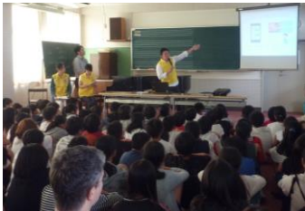
上/新堂中学校、下/治田小学校