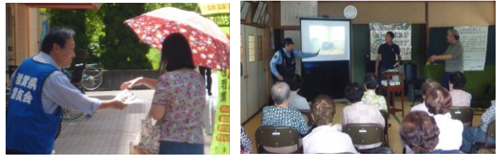
左/アル・プラザ栗東、右/栗東市上砥山三和サロン

6月17日、年金の支給日に伴い、JR草津駅東口2階広場、西友南草津店前、アル・プラザ栗東前にて、草津警察署と警友会草津支部、セキスイハイム近畿社員、草津市、栗東市が合同で特殊詐欺被害防止の啓発を実施しました。7月10日には、栗東市川辺の川辺住宅ふれあいサロンにて栗東市まちづくり出前トークを実施、13日には、栗東市上砥山の三和サロンで草津警察署レイクサイドプロジェクトチームによる寸劇で、それぞれ特殊詐欺被害防止等について学びました。