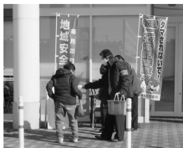
栗東市域での活動

令和5年1月20日、滋賀県防犯協会が行う「地域安全相談所」の開設に合わせ、栗東市のフレンドマーケット栗東店、草津市のコーナン