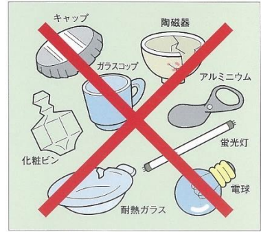
▲ こんなものは、混ぜてはダメ！