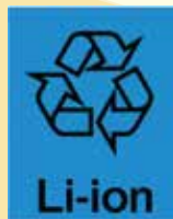
リチウムイオン電池