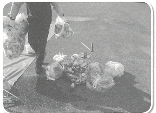
▲植え込みの隙間や側溝の中に空き缶やペットボトルが多く捨てられていました