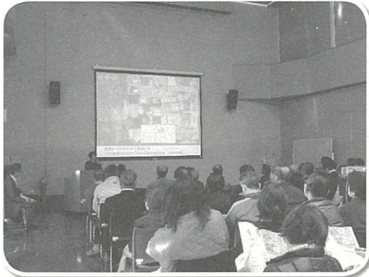
▲100世帯3日分のごみから出た手付かず食品ごみを紹介

ごみを減量するためには、どのような取り組みがあるのか。小学校や自治会でゲストティーチャーを招き、段ボールコンポストの講習会を開催する、地域の地蔵盆の屋台では、割り箸を使用せず、お箸を持参した人に出し物の値引きをする、必要ではないダイレクトメールやカタログは受け取りを断る等、地域や家庭でできる取り組みについて紹介していただきました。