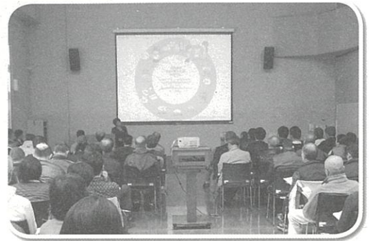
▲体操服をリサイクルするプロジェクトを紹介

地球温暖化を緩和するための対策として、ごみを出す量を減らし、ごみを燃やす際に発生する温室効果ガスを減らすのも方法の一つです。