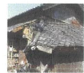
緊急代執行を要する 崩落しかけた屋根