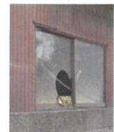
窓が割れた 管理不全空家