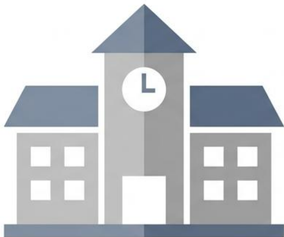
従来の学校部活動