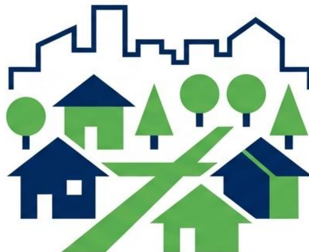
地域部活動クラブ