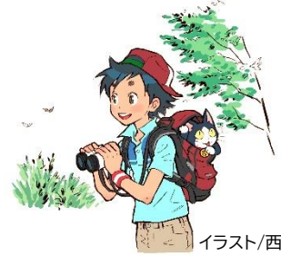
イラスト/西村キヌ