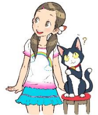
イラスト/西村キヌ