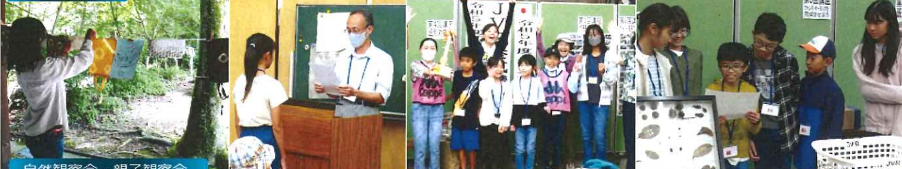
自然観察会・親子観察会