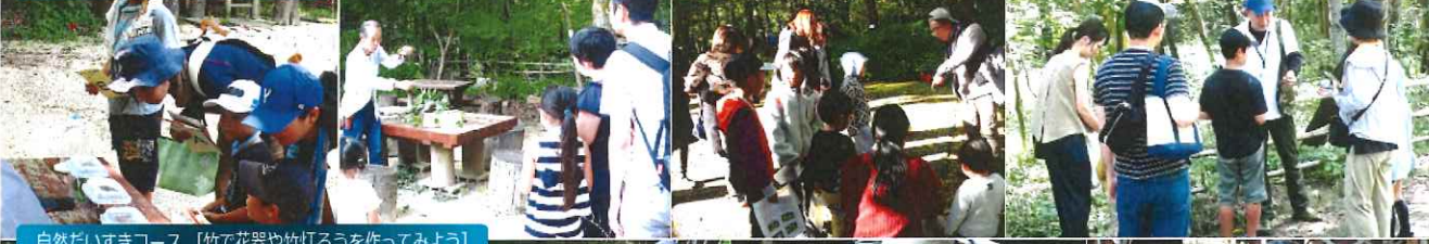
自然だいすきコース [竹で花器や竹灯ろうを作ってみよう]