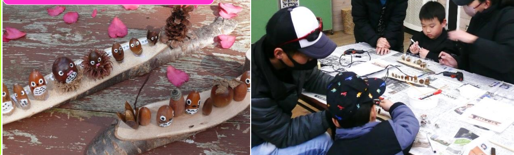
ミニクラフト 3月3日 ドラングリくんのせいくらべ♡