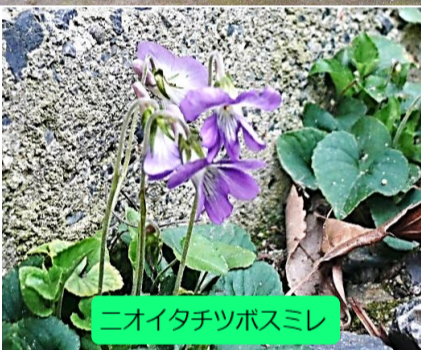
ニオイタチツボスミレ

●春の森をご案内しました。親子観察会限定のクイズに挑戦カード「春の生きものと、タケノコの観察編」と題して、森へ誘いました。オドリコソウに飛来した、キムネクマバチとコマルハナバチのお話と地面に落ちたコジュケイの羽を紹介したところ、音楽教室で楽曲に登場した生きものたちだよと、お子様に紹介されていました。