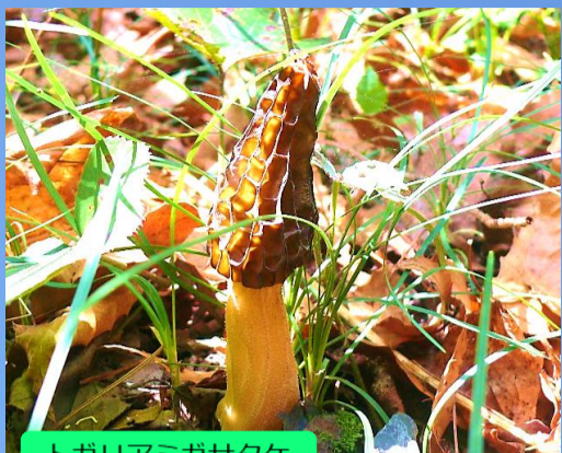
トガリアミガサタケ