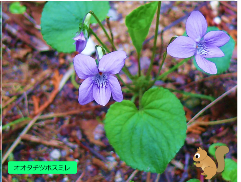
オオタチツボスミレ