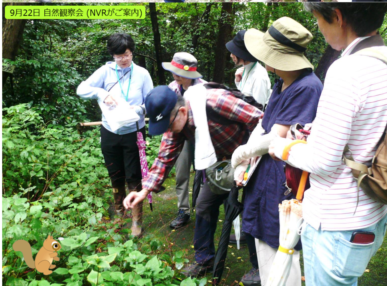
9月22日 自然観察会 (NVRがご案内)