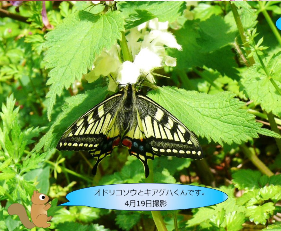
オドリコソウとキアゲハくんです。 4月19日撮影