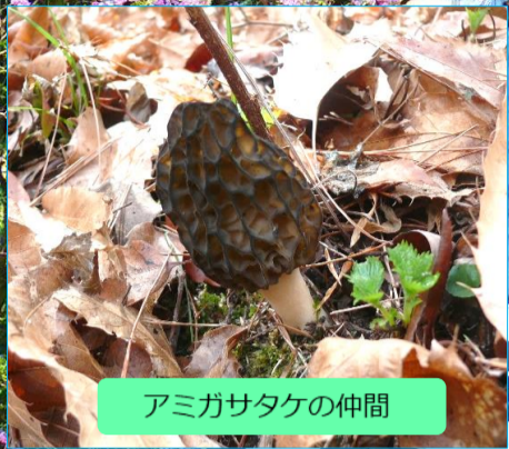
アミガサタケの仲間