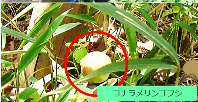
コナラメリンゴフシ