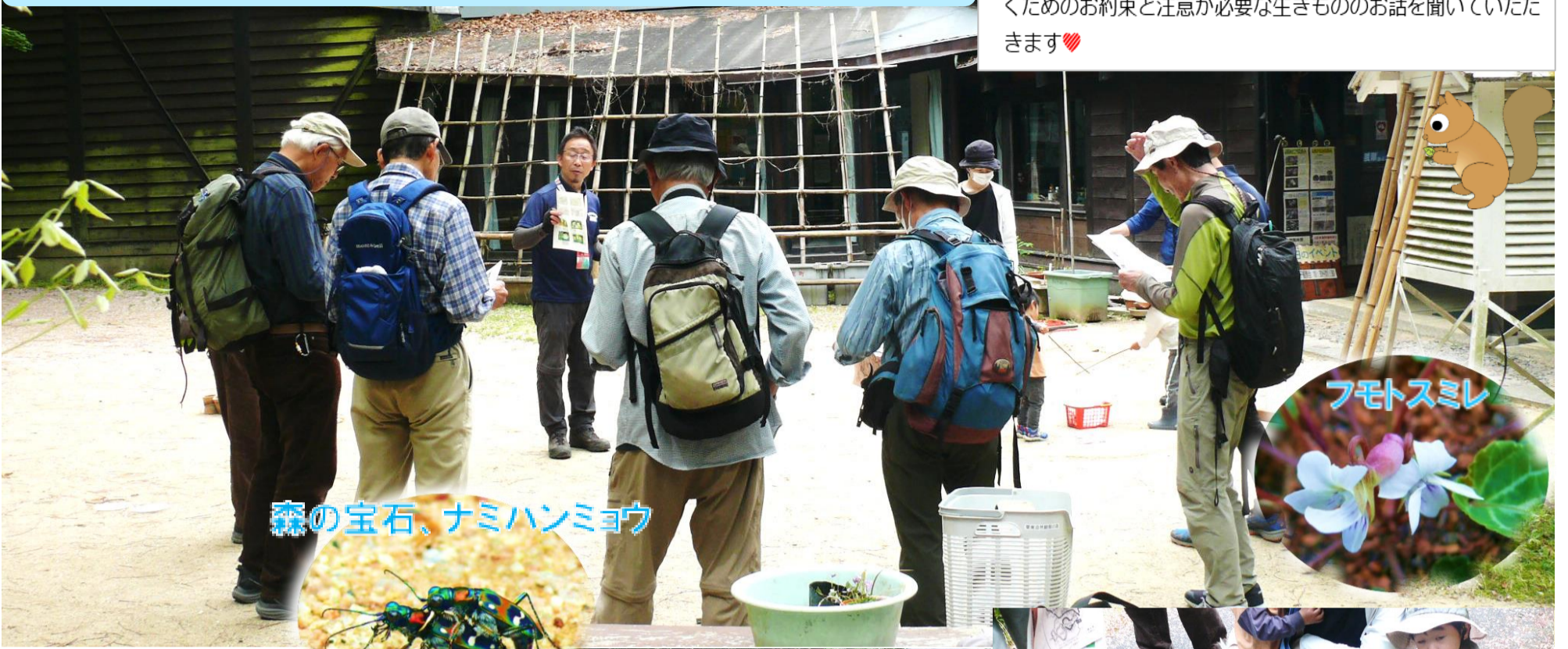
森の宝石、ナミハンミョウ

★はじまりの会では、みなさんが安全に楽しく森を散策いただくためのお約束と注意が必要な生きもののお話を聞いていただきます♡