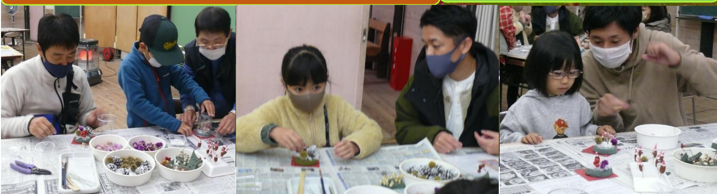
11月14日 【NVR主催】ミニクラフト「プラコップのスノードーム」

＼秋を楽しもう！／「市制施行20周年記 念 3施設秋めぐり」図書館・博物館・自然 観察の森の3施設を巡って、秋を楽しみま しょう！と市制施行20周年記念の3施設ク イズを実施しました。※自然観察の森では、 11月3日まで延長して、ちょうど100名 の来園者様がクイズに挑戦していただきま した。